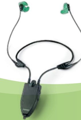
Serenity DP+ Protection auditive dynamique SNR: 24 dB