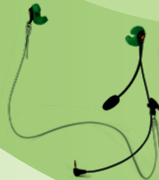
Serenity SPC Protection auditive passive avec communication SNR: 28 dB