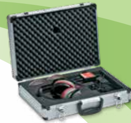
SafetyMeter Protection auditive garantie