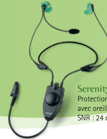
Serenity DPC+ Protection dynamique avec oreillette intégrée SNR : 24 dB