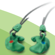
Serenity Classic Protection auditive passive SNR: 29 dB