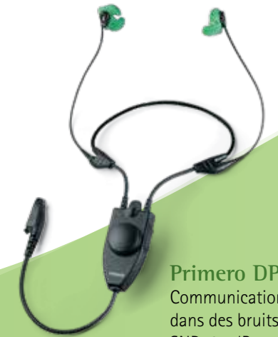
Primero DPC+ Communication naturelle dans des bruits extrêmes SNR: 24 dB

Les coques eShells Phonak sont disponibles dans les couleurs suivantes : ● ● ●