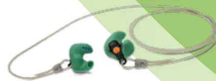
Serenity SP Protection auditive passive modulaire SNR: 28 dB